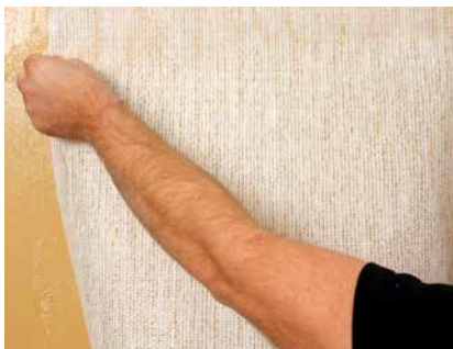
Aufkleben der Glasgewebetapete

Auch für Glasgewebetapeten kann CLAYFIX Lehm-Anstrich eingesetzt werden. Sie ist dabei Klebung und Anstrich in einem, beide Funktionen werden mit einem Arbeitsgang erreicht, frisch-in-frisch ausgeführt. Handelsübliche Dispersionskleber sperren die Untergründe mehr oder weniger ab, mit Lehmfarbe bleiben die Wände diffusionsoffen.