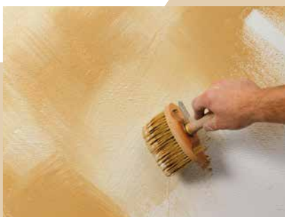
Auftrag der zweiten Farbe

Mit der Mehrfarbertechnik lassen sich besonders lebhaftere und farbenfrohe Effekte erzielen. Beim Ineinanderstreichen von mehreren Farben wird frisch-in-frisch gearbeitet. Die Streichbürste wird abwechselnd in zwei oder mehrere Eimer getaucht.