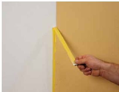
Abziehen nach dem Abwischen