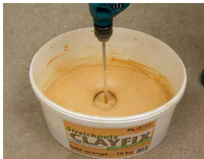
Nach 30 Minuten Quellzeit gut durchrühren