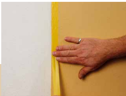
Erneutes Abkleben nach Trocknung