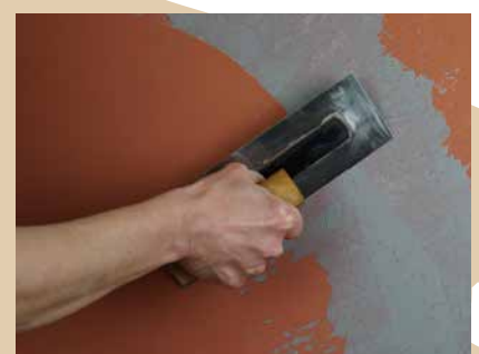
Auftrag der marmorierten Decklage