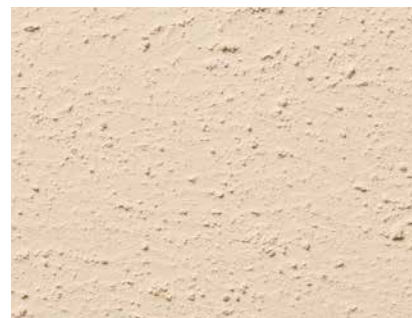
Struktur einer mit Grundierung „DIE GELBE“ vorbereiteten Gipskartonplattenfläche

Vorsicht bei alten Gipskartonplatten! Die Kartonage kann vergilbende Stoffe enthalten, die durchschlagen.