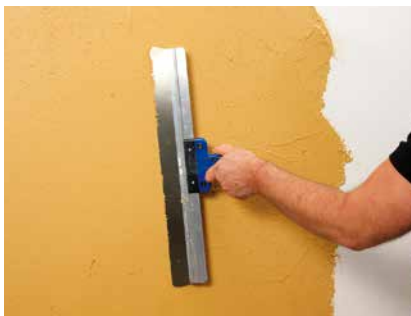
Abziehen mit dem Flächenspachtel