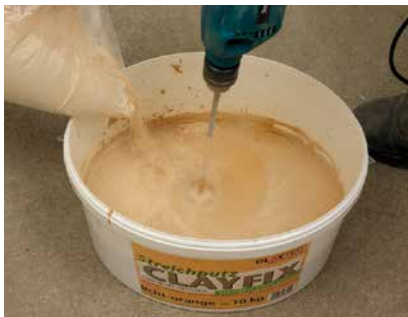
Einrühren des Eimerinhalts in Wasser

CLAYFIX Lehm-Anstrich wird in ca. 10l (dickerer einlagiger Anstrich) bis 15l (dünnere zweifacher Anstrich) sauberem Wasser per Bohrmaschine und Rührstab (Ø 100 mm) mit möglichst hoher Drehzahl eingerührt. Empfehlung: Collomix Rührwerk XO 1 R mit DLX Rührer, Festool-Akkuboehrschrauber PDC 18 mit Rührbesten CS 120 oder Rührwerk MX1600/2 mit dem Rührbesen CS 140. Nach ca. 3 Minuten und erneut nach 30 Minuten Ruhezeit wird das Material 1-2 Minuten gut durchgerührt. Das Material wird in „breiiger“ Konsistenz verarbeitet, es darf nicht von der Streichbürste tropfen. Ein mehrmaliger Auftrag in dünnerer Konsistenz ist möglich. Während der Verarbeitung, insbesondere von CLAYFIX Lehm-Anstrich mit Fein- oder Grobkorn muss der Putz immer wieder aufgerührt werden um ein Absinken des Kornes zu verhindern. Bei längerer Standzeit muss der Bodensatz mit einem rostfreien Spachtel vom Eimergrund gelöst werden. Streichputze und Lehmfarben können abgedeckt oder im geschlossenen Eimer 24 Stunden verarbeitbar gehalten werden. Alle Farbtöne können untereinander gemischt werden.