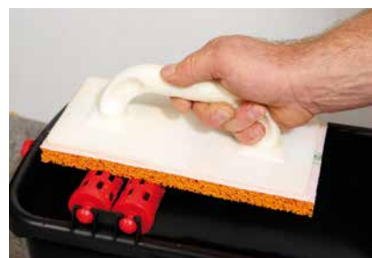
Ausrollen des Filzbretts