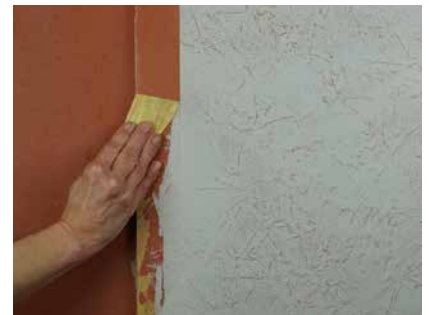
Abziehen scharfer Winkel

Mechanischer Kantenschutz ist am besten mit Eckprofilen zu lösen. Ungeschützte Kanten sind sehr empfindlich, leicht können störende Abplatzungen auftreten. Auch für weniger beanspruchte Kanten sind die Profile zu empfehlen, da eine Kantenausführung nur mit dem Spachtel schwierig ist. Die Profile müssen schon im Putzuntergrund vorgesehen werden.