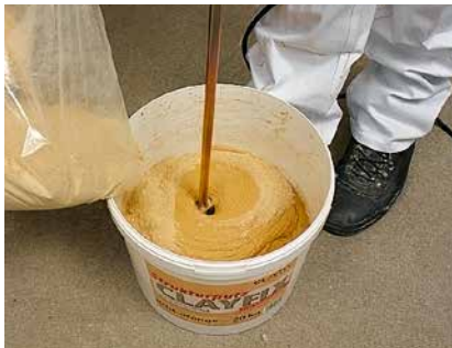
Einrühren des Eimerinhalts in Wasser. Danach 30 Minuten quellen lassen.

Zur Erzielung farbiger Akzente und Effekte können auch Pigmente in die feuchte Putzoberfläche eingearbeitet werden (Arbeitsprobe!).