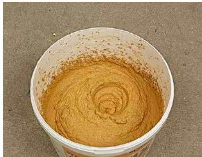
Nach 30 Minuten kräftig durcharbeiten, das Bild zeigt die verarbeitungsfertige Konsistenz