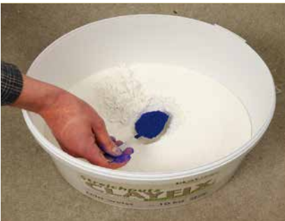
Pigment trocken zugeben