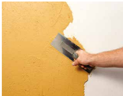
Aufziehen mit dem Glätter