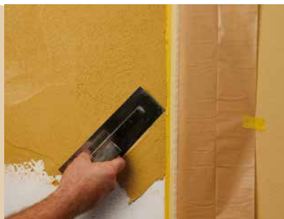
Auftrag der zweiten Farbe