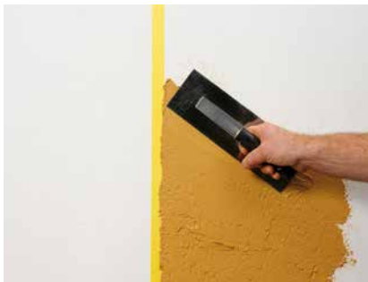
Auftrag der ersten Farbe an das Klebeband

Anders als andere Farbtöne kann YOSIMA WE 0 nach dem Trocknen nicht nur mit einem weichen Schwamm, sondern auch mit einem orangenen Schwamm-brett freigewischt werden. Bei diesem Arbeitsgang kann die Fläche sogar noch nachgerieben werden.