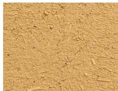
Struktur einer gut vorbereiteten Fläche aus Lehm-Unterputz