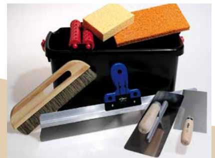
CLAYTEC bietet Japankellen, Schablonen und anderes ausgewähltes Profiwerkzeug an.

Für große Flächen muss also ein entsprechend großer Kübel Material vorbereitet werden!