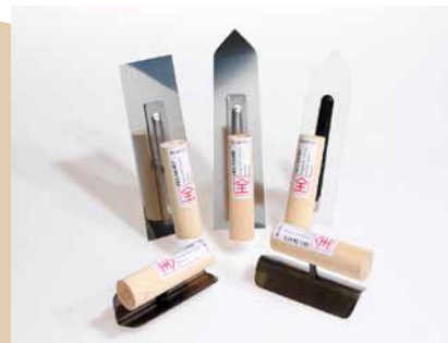
Japan-Glätter und -Feinputzkelle, feine Kunststoffkelle, Kehlen- und Kantenkelle

Helle Putze mit dem Zuschlag Herbs sollten rasch trocknen. Andernfalls färbt das natürliche Chlorophyll dieses Pflanzenzuschlags in den umliegenden Putz aus. Geringe Verfärbungen können durch abermaliges Abschwämmen (mit wenig Wasser) egalisiert werden.