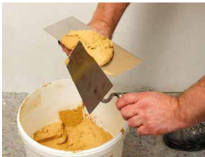
Entnehmen des Mörtels

Der Mörtel kann auch mit der Maschine angespritzt werden. Meist beschränkt sich das Anspritzen auf die Erleichterung des Mörtelantrags. Informationen und Kontaktadressen diverser Hersteller bietet unsere Internetseite www.claytec.de/service/maschinentechnik . Die dort genannten Ansprechpartner haben unsere Produkte mit den jeweiligen Maschinen im Praxistest erprobt und bieten somit kompetente Beratung.