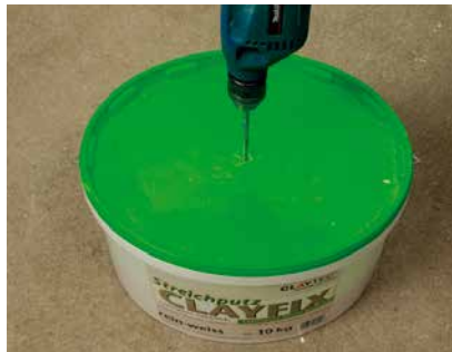
Bei geschlossenem Deckel einmischen