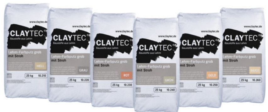
Je Farbton unterschiedliche Gebindelayouts